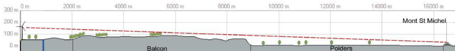
Coupe de principe de la visibilité du site de Baguer-Pican depuis le Mont-Saint-Michel

Le parking d'accès au Mont-Saint-Michel couvre 15 hectares et peut accueillir 4100 véhicules. Il borde les murailles sud du Mont.