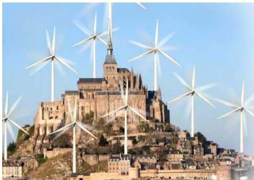
Photomontage de S.O.S. Mont-Saint-Michel

Première caricature : des éoliennes sur le Mont-Saint-Michel